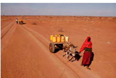
Foto 5: De lokale bevolking moet vaak uren stappen om water te vinden om te drinken en te koken. Het zijn meestal de vrouwen en kinderen die deze zware taak op zich moeten nemen. Kinderen zijn hierdoor soms afwezig van school.

Foto 4: Doordat er weinig regen valt, is er weinig grasland voor het vee beschikbaar. Veehouders en hun families worden gedwongen om te verhuizen, op zoek naar eten voor hun dieren.